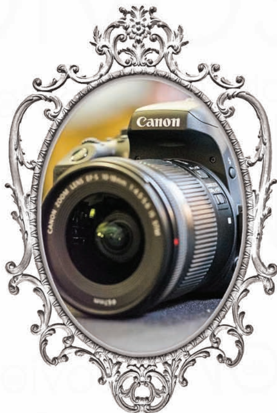
Foto e Filmagem